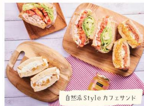
自然派 Style カフェサンド

※月～金(祝日可) 10:30～14:30の間で約3時間(調理・準備の1時間を含みます)