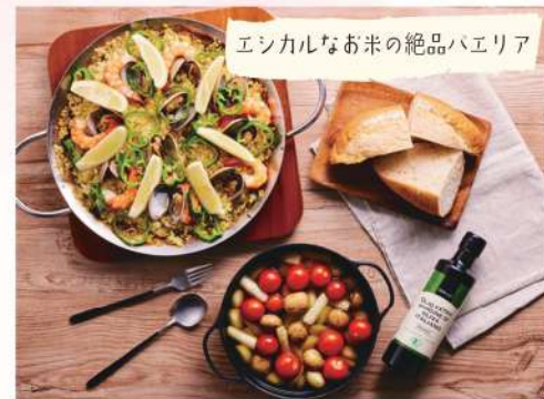
エシカルなお米の絶品バリエア