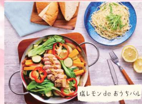
塩しモンde おうちパレ